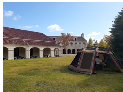
小教室（左）と芝生広場（右）に設置されたテント

▼実証実験の詳細データ（日本感性工学会投稿資料）は、大学研究室サイトより参照いただけます。