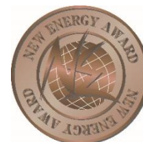
新エネ大賞 新エネルギー財団会長賞 受賞エンブレム

参考URL https://www.nef.or.jp/award/kako/r03/b_09.html