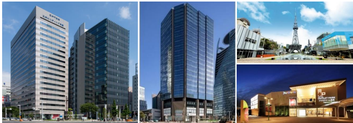
左/名古屋三井ビルディング本館・新館、中央/名古屋三井ビルディング北館 右上/RAYARD Hisaya-odori Park、右下/三井アウトレットパーク ジャズドリーム長島

三井不動産グループと中部電力グループは、今後もパートナーシップを深め、再生可能エネルギー(以下「再エネ」)の開発・活用を積極的に進めることで、入居企業やオーナーの皆様とともに、RE100やESG課題解決への取り組みを推進し、脱炭素社会の実現に貢献してまいります。