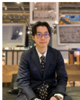
金沢工業大学 産学連携局 連携推進課長・URA