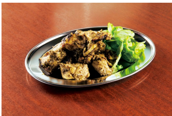
ジャークチキン 500 円（税込）