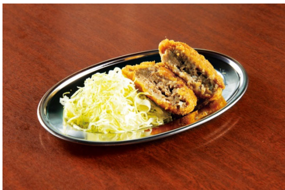
ジューシー二層のメンチカツ 300 円 (税込)