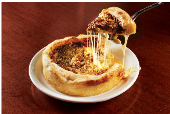
ベアーズシカゴピザ THE ORIGINAL S size 1,800 円（税込）