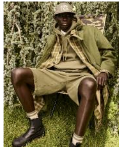
Maison Kitsuné 4月上旬オープン