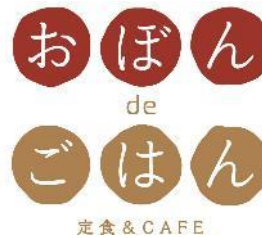
おぼん de ごはん 3月31日（木）オープン