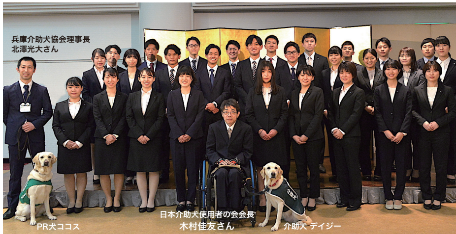
↑ 昨年実施の際の、関係者と新入社員による記念写真(2021.4.1撮影)※撮影時のみマスクを外しました

不動産・リフォーム・広告制作・コンサルティング事業を手がける株式会社ウィル(本社：兵庫県宝塚市、代表取締役社長 坂根勝幸、東証2部：3241)は、来る2022年4月1日(金)、新入社員入社式にて1,613,000円を兵庫介助犬協会等に贈呈しますのでお知らせ致します。※新型コロナウイルスの影響により中止または、規模を縮小する場合がございます。