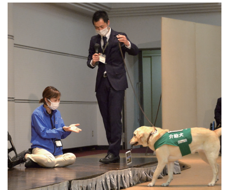
↑ 兵庫介助犬協会の PR 犬が介助犬の仕事が披露されます。写真は昨年の様子。昨年はデビューしたての PR 犬で上手くデモンストレーションができず、何度もトライ。新米 PR 犬の懸命な姿が新入社員たちの共感を呼びました。(2021.4.1撮影)

株式会社ウィルは、2010年1月より「契約募金」制度を開始しました。「契約募金」制度とは、顧客が当社を利用して住まいを購入した場合、自動的に募金ができる制度です。これらの積み上げによる2021年(2021年1月～12月契約分)の募金総額は、1,613,000円となりました(本募金制度開始時からの累計額は、15,750,000円)。来る4月1日(金)、全社員が出席予定の入社式の場において、契約募金を贈呈致します。贈呈式後は、兵庫介助犬協会の PR 犬によるデモンストレーションを行い、全社員に対し介助犬への理解促進を図ります。新入社員は、入社初日に自社の社会貢献活動について理解を深めます。介助犬の育成・普及支援は、持続可能な開発目標(SDGs)の10番目の目標「人や国の不平等をなくそう」に該当すると考え、今後も一企業市民として積極的な啓発活動に取り組んで参ります。