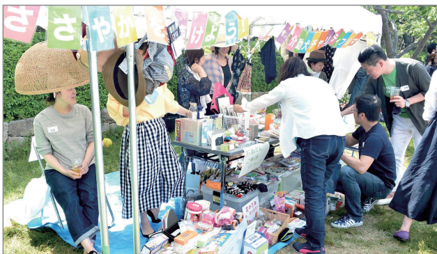
▲社内行事にて、チャリティフリーマーケットブースを設ける(2019年5月撮影)