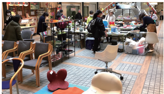
▲地域のイベントでチャリティフリーマーケットを開催(2019年12月撮影)