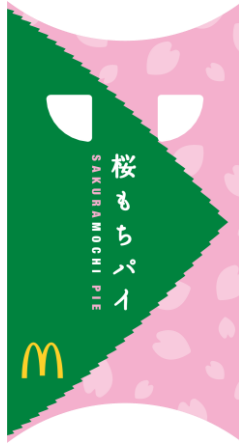
<桜もちパイ パッケージ>

今回、「桜もちパイ」は桜の葉に包まれた桜もちをイメージしたデザインの数限定パッケージで商品をご提供いたします。パッケージから、春の味わいをお楽しみください。