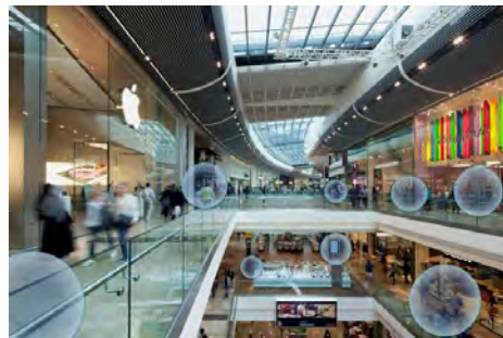
▲館内にBluetoothを設置 ※イメージ

各フロアに近距離無線通信『Bluetooth』を設置し、『ショプリエ』アプリを通して、適切な場所で適切な各フロア情報をPUSH通知にて配信。ユーザーがアプリを起動させる必要なく、各フロアへの来訪を「Bluetooth」が検知し、ユーザーの現在位置に適した館内情報を配信する。※11月～