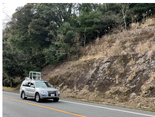
左：のり面モニタリングの様子

リコーはすでに提供している道路やトンネルの点検サービスにのり面を加えることで、道路全体の点検を可能にし、より安心安全なまちづくりの実現を目指します。