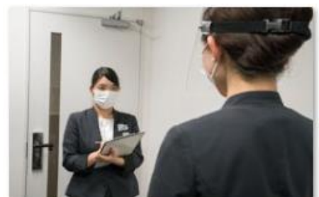
スタッフの体調管理の徹底