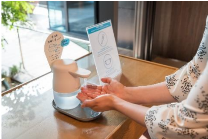
入館、館内施設利用時の検温と消毒