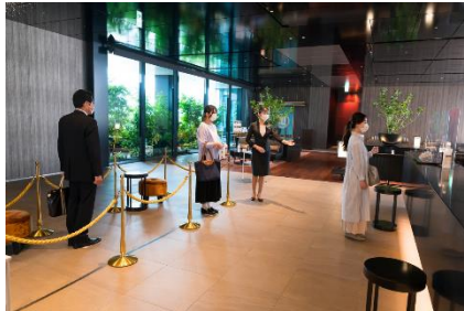
フィジカルディスタンスの確保