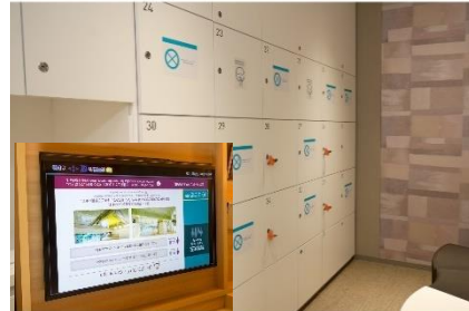
大浴場の利用制限と客室のテレビモニターで利用状況の確認