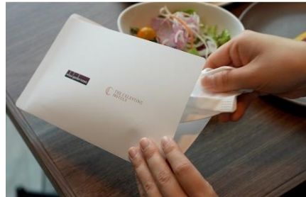
レストラン店内ではマスクケースをご用意