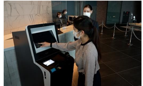
自動チェックイン機導入による接触軽減