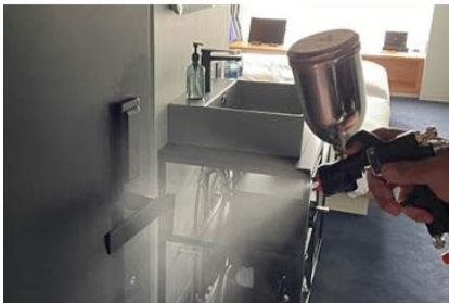
客室内の消毒と抗菌対策の徹底