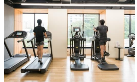
フィットネスなどパブリックスペースの人数制限と消毒の徹底