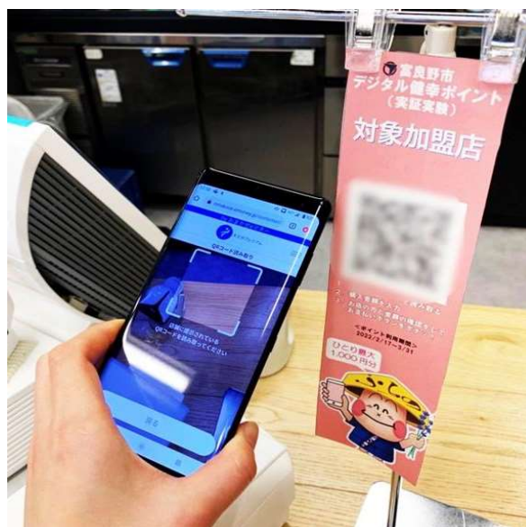
図2 : スマートフォンによる「デジタル健幸ポイント」利用の様子