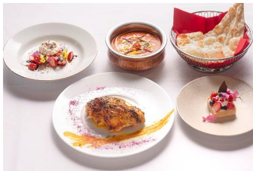
▲プリフィックスコース(NIRVANA New York)