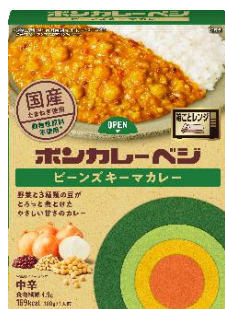
ボンカレーベジ ビーンズキーマカレー 中辛

大塚食品株式会社(本社:大阪府中央区、代表取締役社長:白石耕一)は、ボンカレーシリーズから、植物由来の素材のおいしさを引き出した動物性原料不使用 ※1 の『ボンカレーベジ ビーンズキーマカレー 中辛』『ボンカレーベジ スパイシートマトカレー 辛口』2品を、2022年3月14日(月)から全国で新発売いたします。