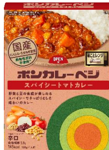
ボンカレーベジ スパイシートマトカレー 辛口

2月12日は「レトルトカレーの日」でもあり「ボンカレーの日」でもあります。大塚食品は、革新的な独自の技術により、それまで世の中になかった世界初の市販用レトルト食品「ボンカレー」を1968年2月12日に発売しました。発売以来、レトルトカレーの定番として長年多くの皆さまにご愛顧いただいております。