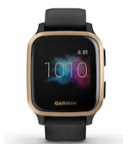
Garmin Venu Sq Music Black/Rose Gold