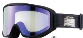
AXE AX800-SPC VI

「glo™ Hyper+ ウィンター・エディション」を購入いただいた方の中から抽選で、紫外線量に合わせてレンズの濃さが変化する調光シングルレンズを採用したスノーゴーグル「AXE AX800-SPC VI」や、GPS/GNSS 機器メーカー「Garmin」のスマートウォッチ「Venu Sq Music Black/Rose Gold」、3軸のメカニカルジンバルを採用したコンパクトなハンドヘルドカメラ「HACRAY POMi Pocket Gimbal」など、ウィンタースポーツにぴったりの豪華景品が当たるキャンペーンも開催します。