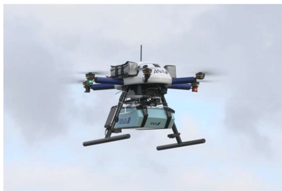
ドローン配送イメージ

2021年6月に内閣官房・厚生労働省・国土交通省より「ドローンによる医薬品配送ガイドライン」が策定されました。アインHDとANAHDは、2021年10月にこのガイドラインに基づく日本初の実証実験を行い、ガイドラインの解釈と課題抽出を行いました。本分科会では、旭川市のような人口密集地域における同ガイドラインに準拠したドローンによる非接触医薬品配送と、積雪寒冷地における無人・自動物流の検討を行います。