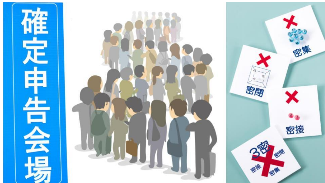
確定申告会場イメージ

ミツモアは仮想通貨の売買益申告に対応した税理士事務所への依頼も可能。依頼時にチェックするだけで、システムが仮想通貨の売買益申告に対応可能な税理士を選び出し、見積もりを提案します