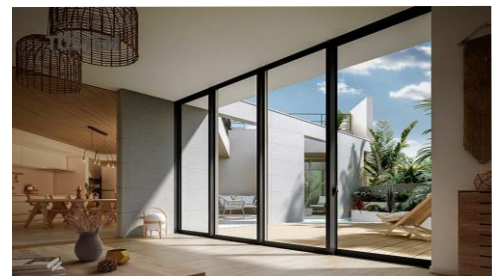
（写真）美しい日本の四季をスリムフレームで切り取るパノラマウィンドウ「TW」

2050年カーボンニュートラルの達成に向けて、世界各国や日本では脱炭素化の取り組みが加速しています。環境省によると住宅を含む家庭部門のCO2削減目標は66%（2013年度比）と他の部門に比べて最も高い数値が設定され、住宅の高性能化による省エネルギー化は重要な施策の一つと位置付けられています。住まいの中でも、特に窓や玄関ドアなど開口部からの熱の流出はおよそ6割と大きく、開口部を高性能化することで、CO2削減に大きく貢献できます。