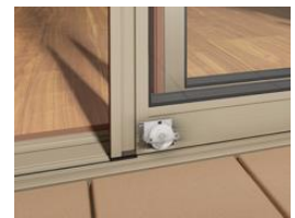
開閉力を大幅に低減

この他にも、手が届かない高窓やシャッターが、リモコンやスマホで簡単に操作できる電動タイプをご用意。今回一部の価格を見直しお求めやすくいたしました。さらに、家の建材や家電がトータルでつながる IoT ホームリンク「Life Assist2」と連携することで、外出先からの操作や、窓・シャッターをまとめて操作、天気予報と連動したシャッター-CLOSE など、窓やシャッターがより便利に安心にお使いいただけます。