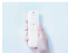
単機能リモコン (本体同梱)