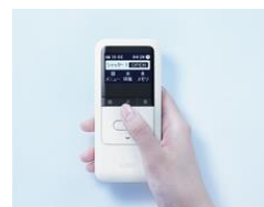
高機能リモコン (オプション)