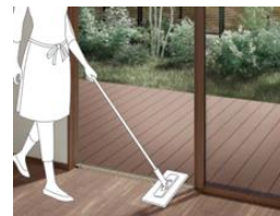
ゴミがたまりにくい構造に