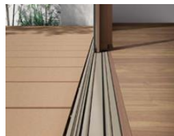
つまずきや転倒を未然に防止