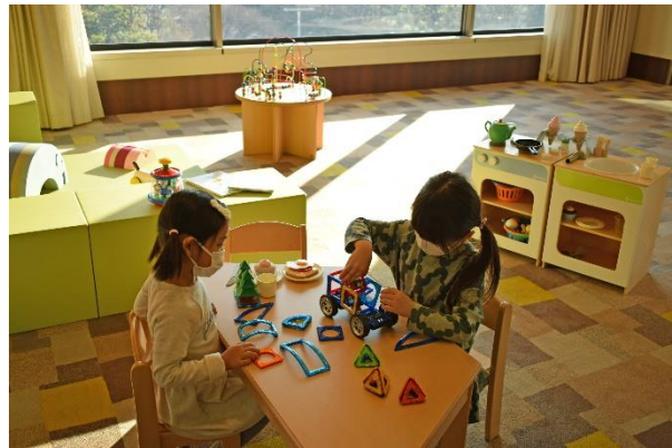
専用ラウンジ内キッズスペースのイメージ

コロナ禍における行動制限で家族旅行や卒業旅行など、ご家族やご友人との思い出作りができなかった方に、様々な設備やスペースを導入し、ホテル館内での飲食や遊びを追加料金なしで満喫していただける新たなプランのご提供を開始します。