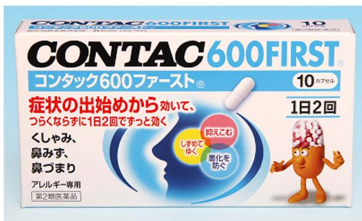
「コンタック 600 ファースト®」 第2類医薬品