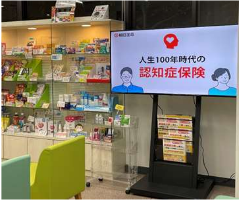
ミアヘルサ日生薬局大井町店の様子