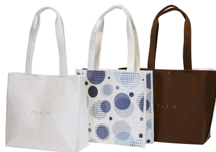
右:「PLAiR」加工例(イメージ)