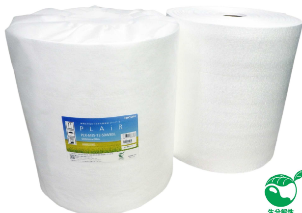
製品イメージ:「PLAiR」ロール

「Driving Sustainability for Our Future. ～持続可能な社会を、ビジネスの力で。」リコーは脱炭素・循環型社会の実現を目指し、「安心して使える」があたりまえの未来に向けて新素材「PLAiR」の開発を進めてまいります。