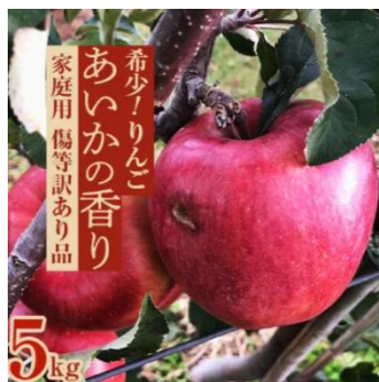
【傷等訳あり】甘い!希少!りんご あいかの香り 5キロセット

掲載ページ： https://www.satofull.jp/products/detail.php?product_id=1109778