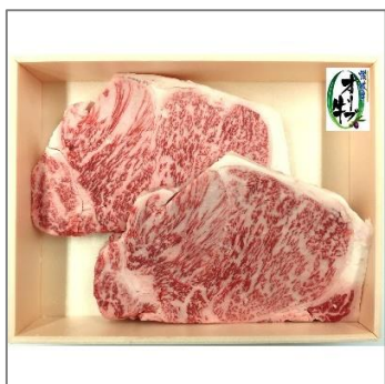
＜「コロナ支援」＞オリーブ牛 ロースステーキ500g(2枚)