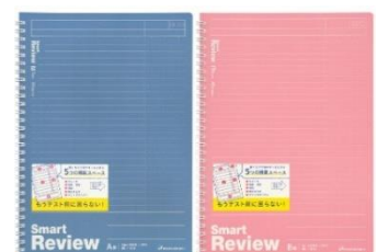
<デザインイメージ>