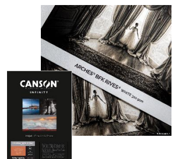
アルシュ・BKFリープ・ホワイト