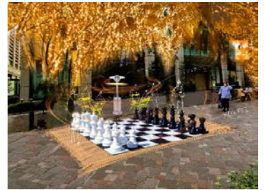
「ビッグチェス」イメージ