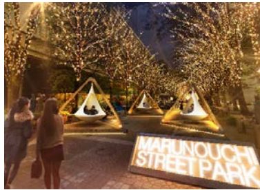
2〜3名が入れる「鳥の巣ツリーハウス」イメージ