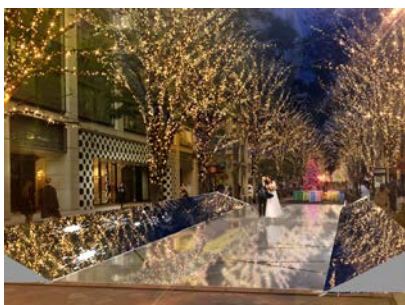
「光の回廊」イメージ

イルミネーションをより楽しめるフォトスポットが登場。小岩井農場（岩手県）のウラジロモミを使用したクリスマスツリーが通りの真ん中に立つ他、ミラーを敷き詰めた「光の回廊」や、屋外にいても暖かい「ホットベンチ」を設置します。「Marunouchi Street Park 2021 Summer」に引き続きアーティストが期間中に制作活動を展開する「アーティスト in テラス」の傍にも色が変わる幻想的な疑似炎のテラスメラウンジの「ファイヤーテラス」を設置します。