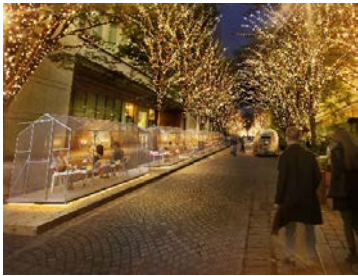
「グラスハウスレストラン」イメージ

大丸有エリアを代表するホテル「ザ・ペニンシュラ東京」と「東京ステーションホテル」によるキッチンカーが出店し、シャンデリアが飾られたプライベートハウスをイメージした「グラスハウスレストラン」や、ツリーハンモックでゆったり過ごせる「鳥の巣ツリーハウス」、炎を囲んで暖を取る「ファイヤービット」などで、ホットドリンクやコーヒーをお楽しみいただけます。身体と頭を動かして暖まる「ビッグチェス」など遊び心も満載のエリアです。グラスハウス・鳥の巣ツリーハウス・ファイヤービットなどの造作物は、安全性確保のために、乃村工芸社トレーディングセンターにてさまざまな検証をおこないました。