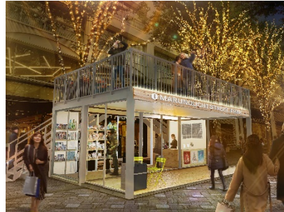
受付・観光案内・物販の機能やフォトスポットの役割も果たす 2階建て「インフォメーションセンター」イメージ