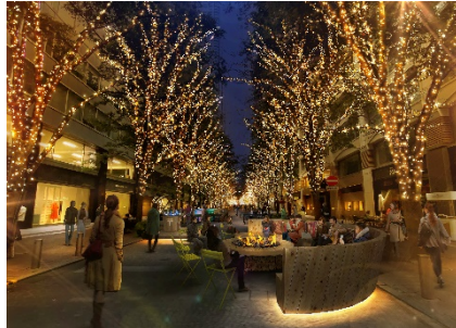
炎を囲んで暖を取る「ファイヤービット」イメージ

音楽やアート、ストリートパフォーマンス、ワークショップなどのアクティビティが登場します。来街者によって音楽を自由に奏でられるを「ストリートピアノ」や、燃え盛る疑似炎の投函口にクリスマスカードを入れる「炎のポスト」、風よけを設置したビリヤード台で身体を動かして暖まる「ビリヤードストリート」の他、炎を囲んで暖を取る「ファイヤービット」などのラウンジ空間もご用意。また今回、2階建てのインフォメーションセンターが登場します。本インフォメーションセンターは、「Marunouchi Street Park」の案内場所として機能するほか、クリスマスカードやグッズの販売等も行ないます。階段を上がった2階エリアは、イルミネーションをより近くに感じられる空間となっており、フォトスポットとしてもお楽しみいただけます。