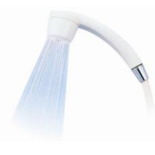
C賞 : 塩素を除去！ クリンスイ浄水シャワー (SY102):200名