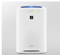
A賞 : 空気の汚れを除去！ シャープ 加湿空気清浄機 「プラズマクラスター」:20名