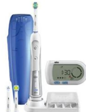
B賞 : 歯垢を除去！ ブラウン 電動歯ブラシ オーラルBデンタブライド :30名