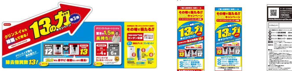
「13の力」キャンペーンPOP(左)と、キャンペーンシール表面(中)、シリアルナンバーが記載された裏面(右)