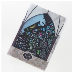
【街まち】2 ポケット ファイル/レトロ 長崎