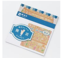
【街まち】ステッカー(2枚) /レトロ 難波