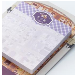
【街まち】ふせん /レトロ 名古屋