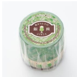
【街まち】マスキングテープ (2本)/レトロ 銀座