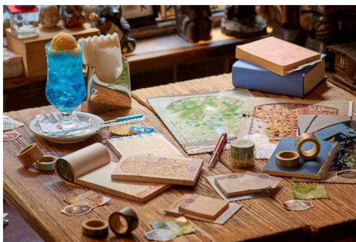
「街まちレトロ」ステーションナリー キービジュアル