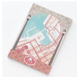
【街まち】A6 メモパッド /レトロ 門司港