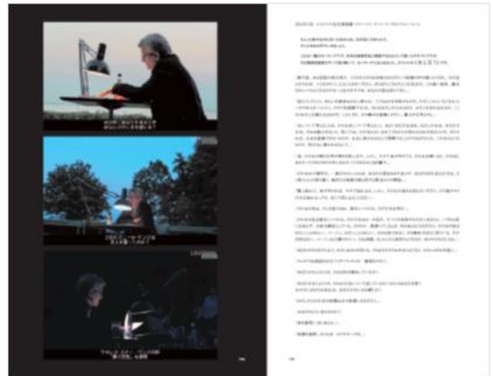
《水と言う》パフォーマンスの様子とスクリプト