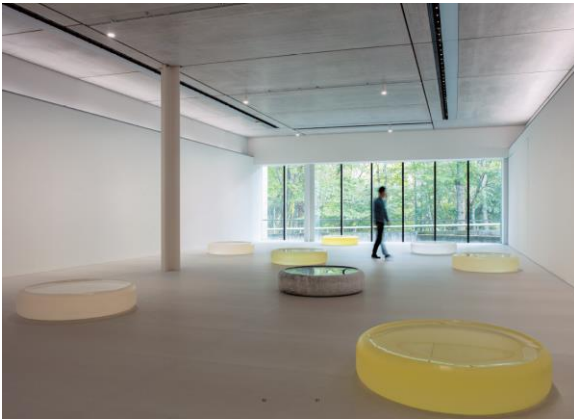
ガラス彫刻作品の展示風景