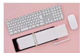
キーボード前にもフィット