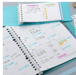
スケジュール管理