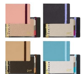
カラーバリエーション