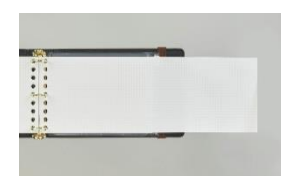
ルーズリーフミニ ワイド