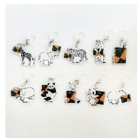
アクリルマルチマーカー

※本製品は大型イベント限定の企画のため、通常、文具・小売店での販売はしていません。