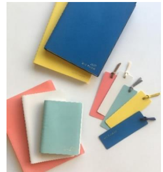
上: セプトクルール ダイアリーブックマーカー 下: 使用イメージ

2020年に新素材を使用し、発売した『セプトクルール』の2022年1月始まりのダイアリーを文具女子博限定で販売します。セプトクルールは手になじむ素材と自分らしさを表現できるカラーでご好評をいただいています。今回発売するダイアリーの罫線の色は、“自分らしい色づかい”を引き立てる、ダークブラウンとオレンジを採用しました。マンスリータイプのA5、ミニサイズ、ウィークリータイプのバイブルサイズの3サイズを各5色、それぞれ100冊限定で発売します。