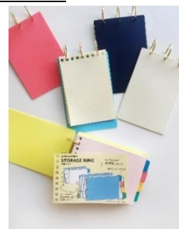
ルーズリーフミニ ストレージリング

3月に実施した「ルーズリーフミニ使い方大募集キャンペーン」のアンケートで約半数の方が希望した「ルーズリーフミニを保管したい」という声にお応えし、『ルーズリーフミニ ストレージリング』を文具女子博限定で発売いたします。200枚がたっぷり入る収納力で、360°表紙が折り返せるため、コンパクトに見返しができます。全5色を各色100冊限定でご用意しました。