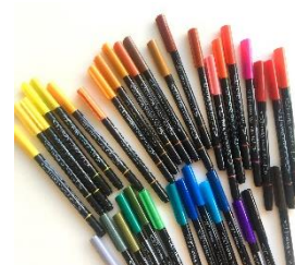
リラ アクア・ブラッシュ・デュオ