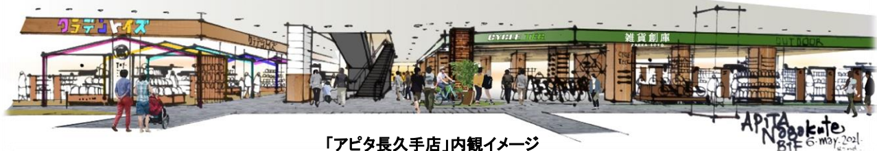
「アピタ長久手店」内観イメージ