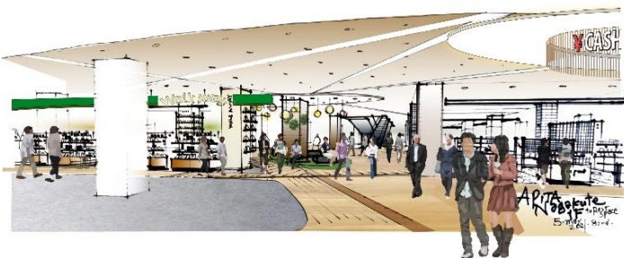
1階 ファッションフロア・イメージ

30~40 代のファミリー層をターゲットとし、レディース・ティーンズのカジュアルウェアや、メンズのアウトドアウェア、服飾雑貨・スニーカーなど専門性を高めた 13 の直営コーナーを展開します。ゆとりある空間に加え、約 12 店の衣料関連テナント専門店と融合した一体感のある通路レイアウトで、お客さまが自然と買い回りできる空間を創出します。