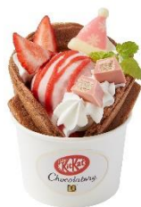
キットカット ショコラトリー