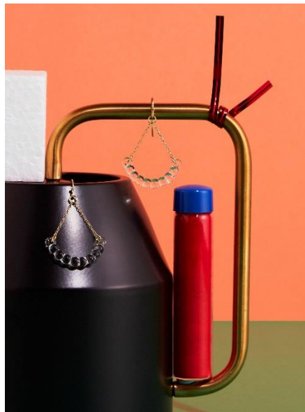
HARIO Lampwork Factory