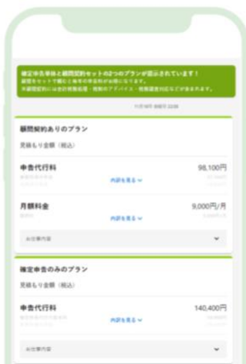
依頼者画面：セットプラン表示