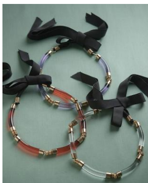
【VTOPIA】 JELLY CHOKER ¥15,750(税込)