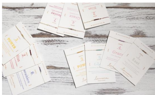
【Lamana】 Chakra Collection “Tula”シリーズ ¥7,350～¥18,375(税込)