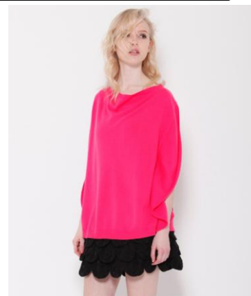
【Clean2】 カシミアサークルニット ¥29,400(税込) 刺繍ティアードスカート ¥22,050(税込)