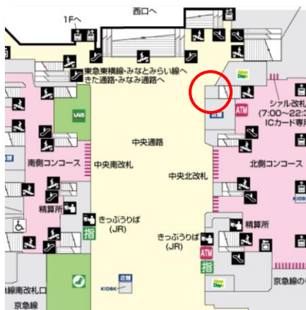
横浜駅中央通路 略図

(3) 場所:YOKOHAMA SEEDS(JR 横浜駅中央通路内) (左下図赤丸)