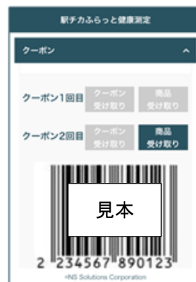
クーポン表示画面イメージ

※割引クーポンは 2 回目の測定結果登録・アンケート回答までのご提供となります。また、NewDays シアル横浜店以外でのご利用はできません。 ※以下の商品との同時会計、及びその他キャンペーンとの併用はできません。