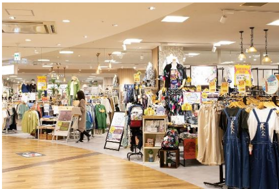
衣料品売場のイメージ

2 階では、衣料と文具・玩具の品揃えを大幅に拡充した直営ゾーンと、テナント専門店ゾーンの世界観を融合させ、お客さまが自然と買い回りできる環境を創造します。