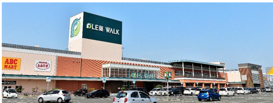
「プレ葉ウォーク浜北」外観

「プレ葉ウォーク浜北」は、アピタと約150のテナント専門店で構成され、2002年に開業しました。今回、初の大規模なリニューアルとして、アピタの売場面積を約2割増の約12,900㎡に拡大し、テナント専門店を一部刷新することで、従来の客層に加え、浜北エリアのニューファミリー層や若年層のニーズにお応えできる「次世代のモール型ショッピングセンター」へ生まれ変わります。