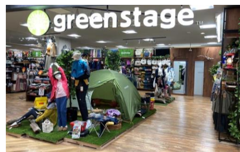
「グリーンステージ」のイメージ

「パワフルプライス ユードラッグ」は直営ドラッグストアで、医薬品と日用消耗品などは、地域最大級の品揃えとお値打ち価格が特長です。生活雑貨の「雑貨創庫」は、キッチン用品とタオルを拡充し、生活雑貨・収納用品・清掃・洗濯関連品のほか、理美容・季節・調理関連の家電商品を品揃えします。また、近年、人気が高まっているアウトドアのニーズにお応えし、アウトドアブランドのウェアと雑貨などを一か所で展開する「greenstage(グリーンステージ)」、子供・通学・スポーツ用自転車豊富に揃える「CYCLE TEC(サイクルテック)」、韓国コスメも新たに取り扱い、化粧品「Beauty Terrace(ビューティーテラス)」を併設します。