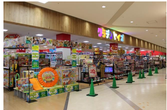
「クラデントイズ」のイメージ