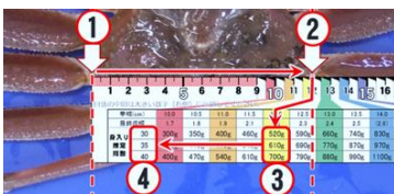
↓身入りスケールと測定方法