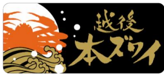
↑越後本ズワイ商標

新潟産ズワイガニの旗印である、『越後本ズワイ』として出荷されるためには厳しい選別基準があります。