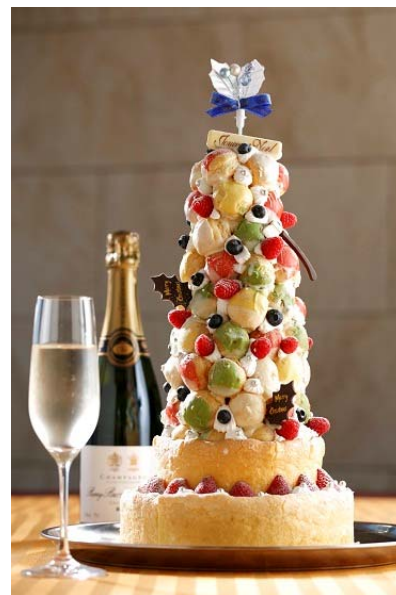
「クリスマス タワーケーキ」