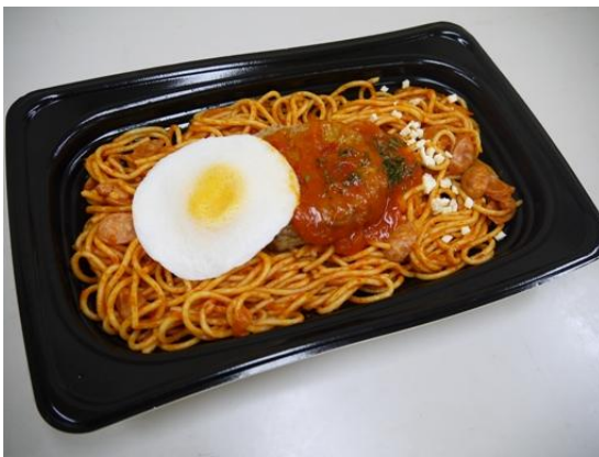
トマトソースハンバーグのナポリタン 397円

合同会社西友では、主婦や若者世代に人気の高いパスタを全面リニューアルし、若い男性層の獲得を目指したボリュームが自慢のパスタなど全6品目を、9月12日（木）より全国の西友369店と西友の子会社「若菜」の惣菜専門店55店、合計424店で発売いたします。