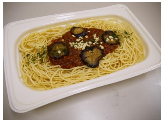
なすとモzzarellaのミートソース 397円

西友では今年3月に、若い男性をターゲットにした総重量500g超の「デカうま弁当」を発売し、お客様から大変好評をいただいております。これを受け、パスタにおいても「がっつり食べたい」という若い男性のニーズにお応えするために、通常サイズの約40%ボリュームアップした商品を発売します。ボリュームたっぷりの麺に、具だくさんのソースとハンバーグやナスなど存在感あるトッピングを載せた「トマトソースハンバーグのナポリタン」と「なすとモzzarellaのミートソース」の2種類を397円でご用意。十分な食べ応えを実感いただけるメニューといたしました。