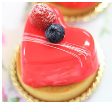
戸板女子短期大学部内コンテスト 入賞作品①「Happiness to you」

美味しさとともに「映え」にこだわるミレニアル世代の新たな創造性を商品企画に活かすとともに、コロナ禍で学園祭などのイベントが昨年来制限された学生にとっての成功体験の場となることを願い、本企画が実現いたしました。