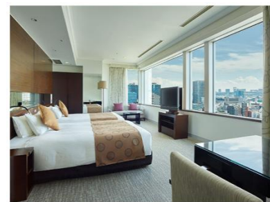
客室(エグゼクティブコーナーツイン)

【賞品】 グランプリ作品を製作されたチームメンバー全員に宿泊招待券を プレゼントいたします。