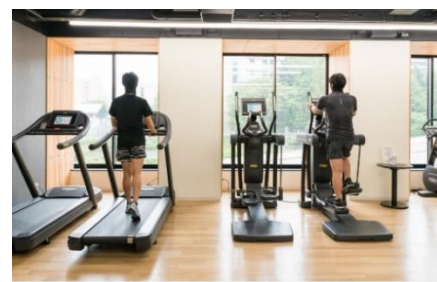
フィットネスなどパブリックスペースの人数制限と消毒の徹底