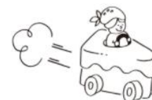
「cake to go」ロゴマーク