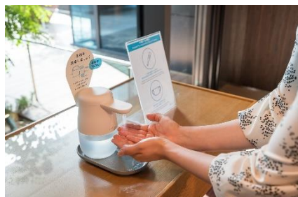
入館、館内施設利用時の検温と消毒