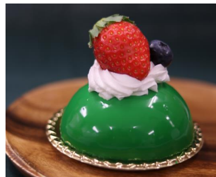
戸板女子短期大学部内コンテスト 入賞作品③「チーズっ茶」