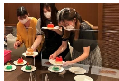
入賞作品のお披露目会