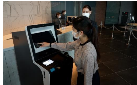
自動チェックイン機導入による接触軽減