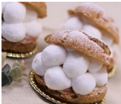
戸板女子短期大学部内コンテスト 入賞作品②「くるん」