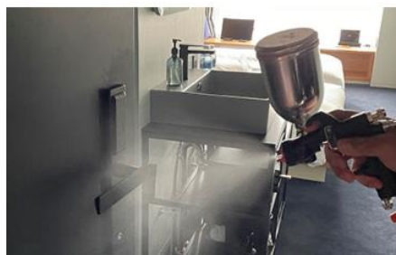
客室内の消毒と抗菌対策の徹底