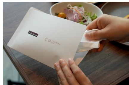
レストラン店内ではマスクケースをご用意