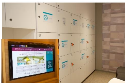
大浴場の利用制限と客室のテレビモニターで利用状況の確認