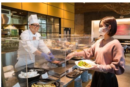
レストラン店内の亚克力ボード設置とマスク・手袋着用徹底(ビュッフェ)