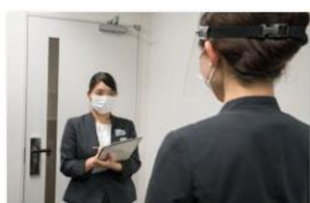
スタッフの体調管理の徹底