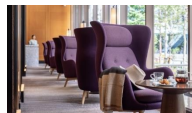
カフェ&バーラウンジ「セレクトロワ」