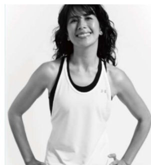
応援ゲスト 長谷川理恵