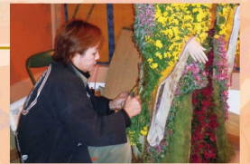
菊付け実演の様子

■ 開催時期 | 不定期 ※花の開花状況によります。12月4日以降の実演はありません。