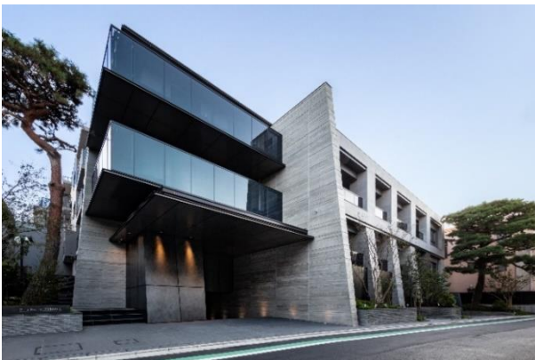
【パークホームズ中目黒】

今後も当社住宅事業のブランドコンセプト「Life-styling × 経年優化」のもと、多様化するライフスタイルに応える商品・サービスをご提供するとともに、安全・安心で末永くお住まいいただける街づくりを推進することで、持続可能な社会の実現・SDGsへ貢献してまいります。