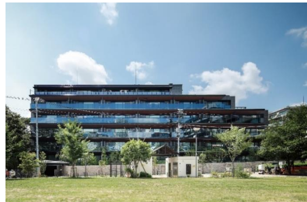
【パークホームズ中野本町 ザ レジデンス】