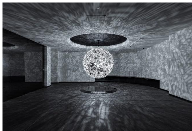
【エントランスホール】