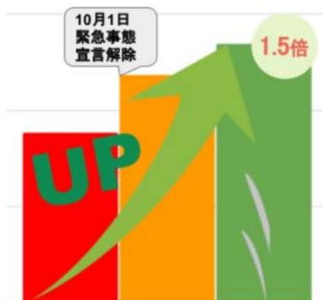
七五三写真の出張撮影 依頼数