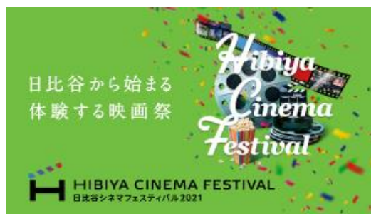
HIBIYA CINEMA FESTIVAL 2021 メインビジュアル