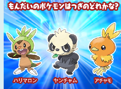
※画面は開発中のものです。