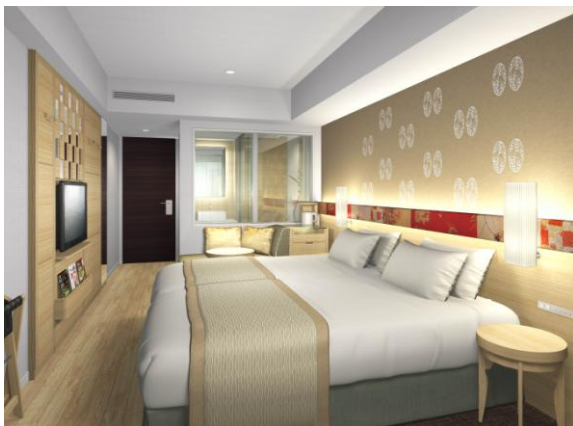
「みやび 雅」 ツインルーム(イメージ)

観光やビジネスに絶好のロケーションと独自のコンセプトやデザインを活かし、国内観光客(特に 30 代の女性)をメインに、海外からの個人観光客やビジネスニーズにも対応します。