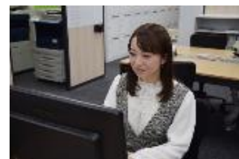
職場で活躍するミラエール社員

「ミラエール」に入社をする方の約72%が採用時では販売サービス職を中心とした事務職未経験者のため（20年度・全国）、研修・教育、入社後のキャリアサポートを充実させています。