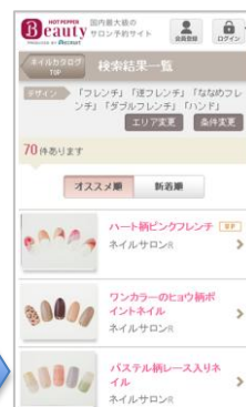
トップで選択した検索 条件に紐づいたネイル 写真が表示