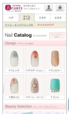
スマートフォン 「ネイルカタログ」トップ