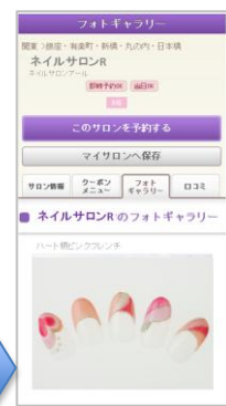
細かいデザインも 大きな写真で見 ることができ、こだわ りを追及できる

【本件に関するお問い合わせ先】 https://www.recruit-lifestyle.co.jp/support/press/