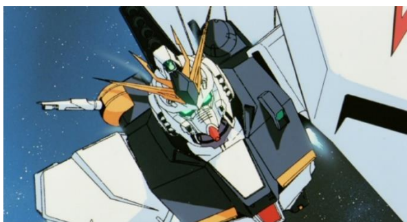
『機動戦士ガンダム 逆襲のシャア』©創通・サンライズ

『機動戦士ガンダム』シリーズ総監督。演出家。1941年生まれ、小田原市出身。TVアニメ『鉄腕アトム』の演出を経てフリーに。主な監督作品に『機動戦士ガンダム』『伝説巨神イデオン』などがある。作詞、小説の執筆なども手掛ける。