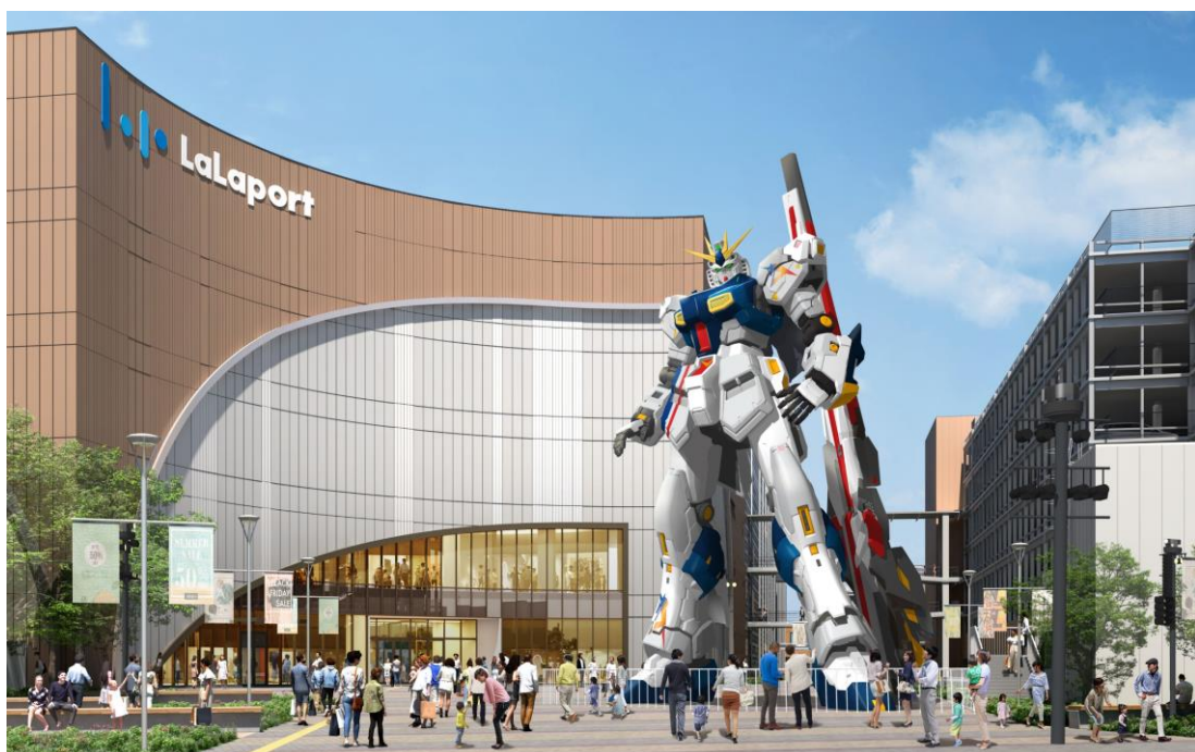
「実物大νガンダム立像」イメージパース ©創通・サンライズ