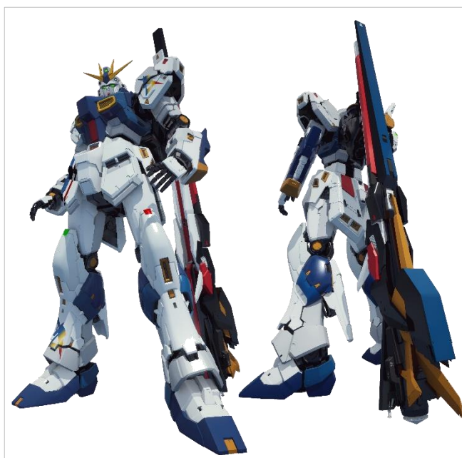
「RX-93ff νガンダム」©創通・サンライズ